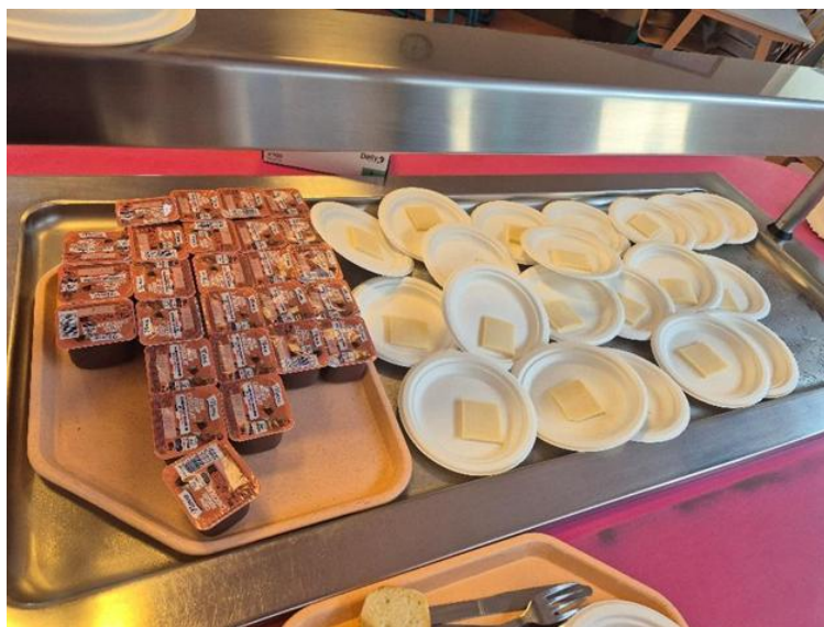
Légende : Vue de la table froide dédiée aux desserts.