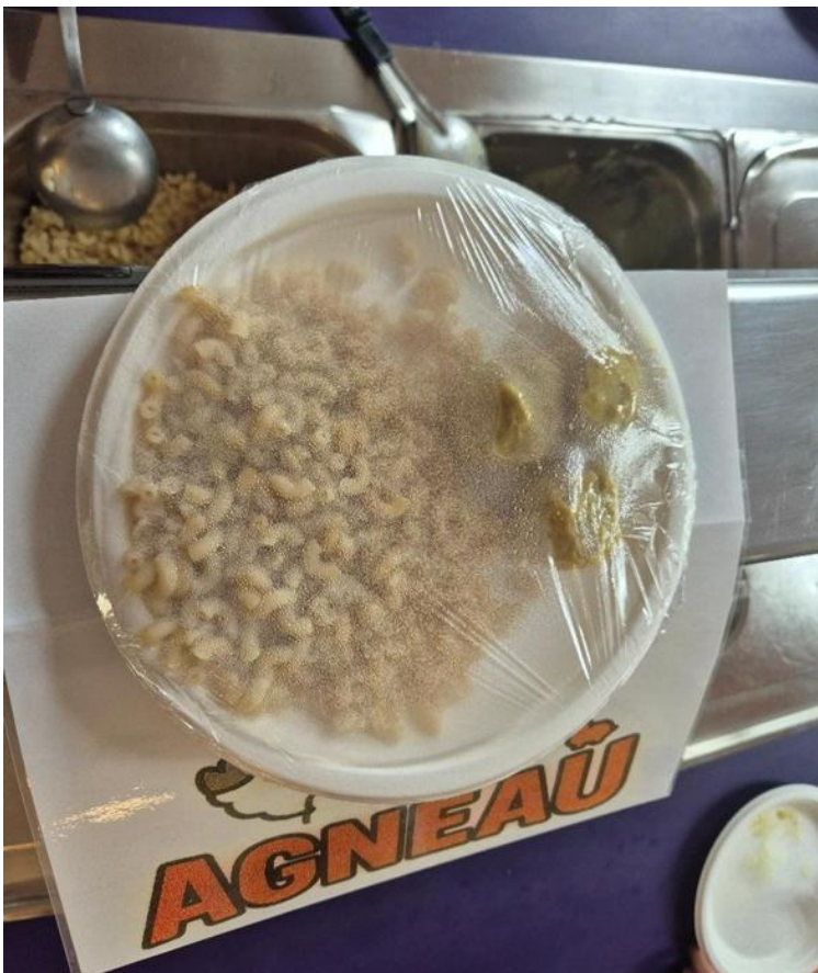
Photo 4 – Plat témoin (coquille semi complète et boulette d'agneau)

Légende : Présentation du plat témoin observé lors de la visite (plat servi avec ou sans sauce).