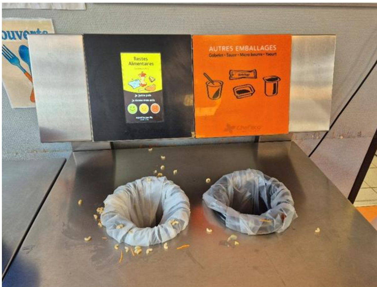
Légende : Vue d'une table de tri utilisée par les élèves à la fin du repas (2,4kg enregistrés).