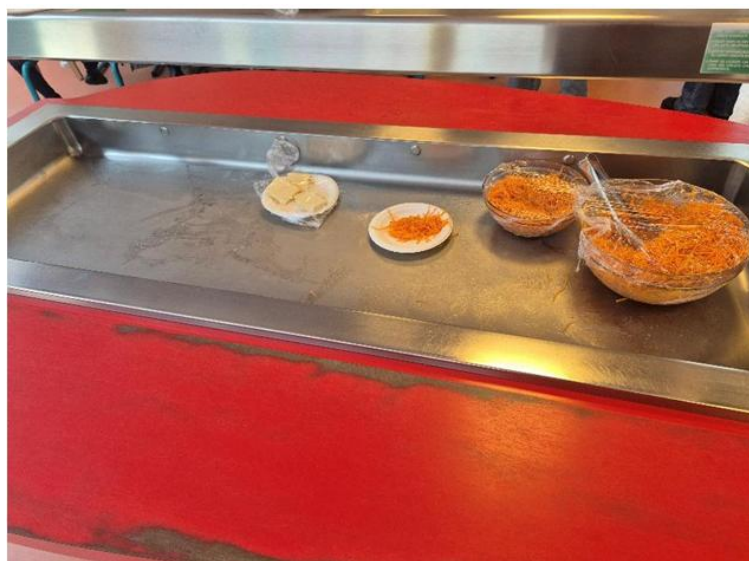
Légende : Vue de la table froide dédiée aux entrées.